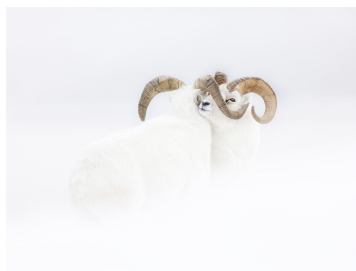
DANS LE MONDE BLANC DE JÉRÉMIE VILLET