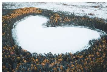
AUX PAYS DES BRUMES