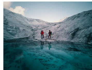
DEUX PAS VERS L'AUTRE