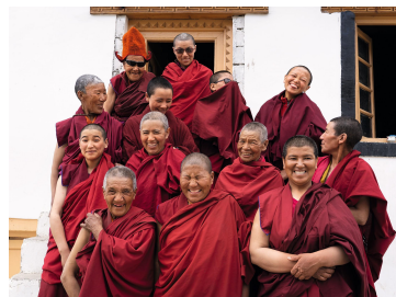
SEMEUSES DE JOIE