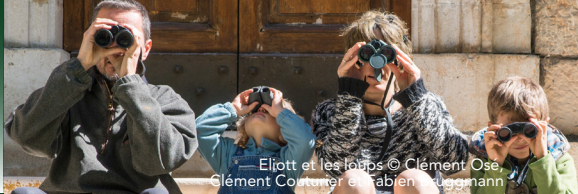
— Elliott et les loups © Clément Ose Clément Comte et Fabien Guggmann