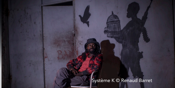
Système K