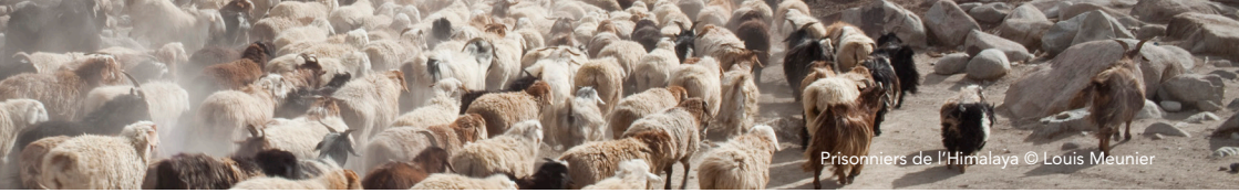
Prisonniers de l'Himalaya © Louis Meunier